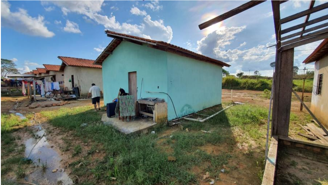
Figura 1 – Moradia Rural onde os atendimentos foram realizados